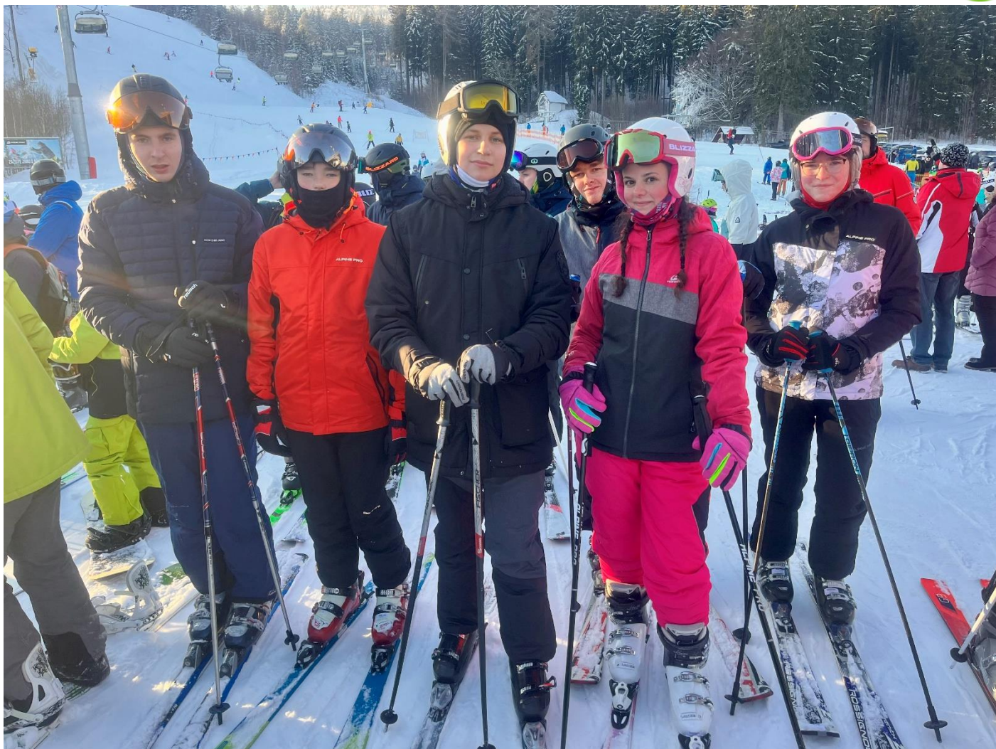
Mládež na horách.